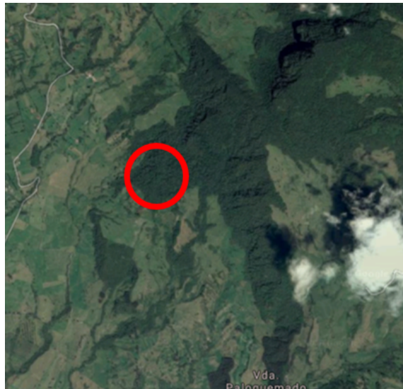
Imagen No. 2. Ubicación aproximada del lugar de liberación.

Aun cuando la fauna asociada al DMI se encuentra bastante limitada por el desarrollo de las actividades antrópicas, aún persisten especies de mamíferos como conejo ( Sylvilagus brasiliensis ), ardilla ( Sciurus granatensis ), armadillo ( Dasyus novemcinctus ), fara ( Didelphis albiventris ), ratones silvestres y murciélagos. Se encuentran así mismo, una importante variedad de aves, algunos reptiles y varias especies de ranas de los géneros Dendropsophus e Hyloscirtus . Dentro de las especies en peligro crítico de extinción se reporta la salamandra ( Bolitoglossa capitana ), con distribución limitada a las partes altas del municipio de Albán.