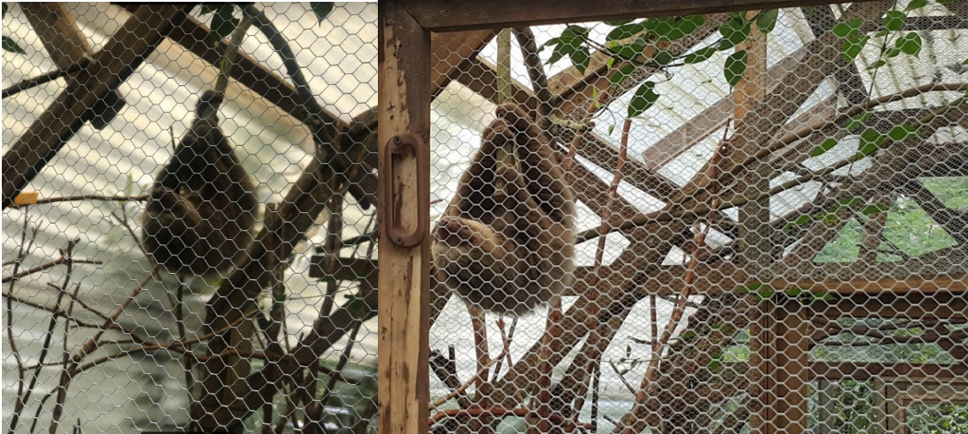
Fotografía No. 2. Ejemplar de Choloepus hoffmanni en el CAVR de la Fundación AIUNAU.