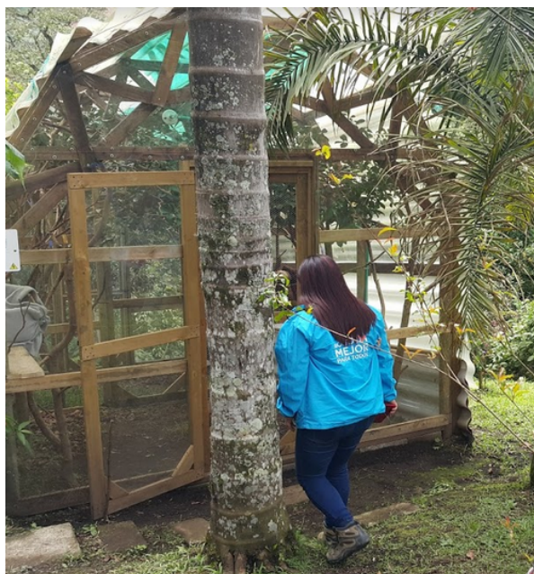
Fotografía No. 1. Cerramiento donde era mantenido el ejemplar de Choloepus hoffmanni en el CAVR de la Fundación AIUNAU.

Durante la visita técnica realizada a las instalaciones del CAVR de la Fundación AIUNAU el 18 de abril de 2018, se observó que el ejemplar era mantenido en excelentes condiciones ambientales y de cerramiento, que permitían la rehabilitación del individuo según su especie. El ejemplar se mostró activo, colgando de las ramas superiores de su cerramiento, realizando desplazamientos cortos y lentos, acordes a la especie. Según lo informado durante la visita, el ejemplar no había mostrado ningún tipo de enfermedad o afectación médica, y por el contrario se había adaptado satisfactoriamente en su proceso de rehabilitación.